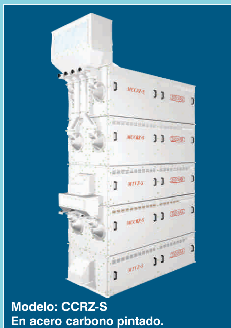
Modelo: CCRZ-S En acero carbono pintado.