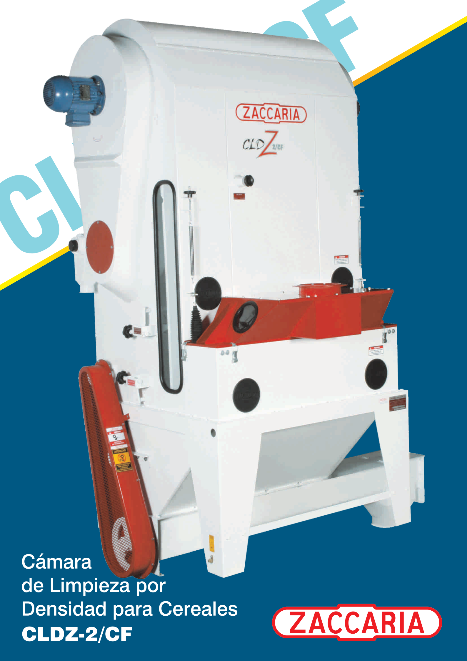
Cámara de Limpieza por Densidad para Cereales CLDZ-2/CF